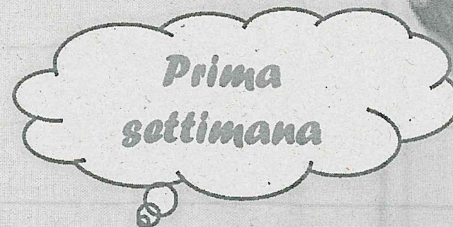
TABELLA DIETETICA AUTUNNO/INVERNO

Scuola DELL'INFANZIA E PRIMARIA Comune di ORIA (BR)