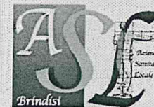
TABELLA DIETETICA AUTUNNO/INVERNO Scuola DELL'INFANZIA E PRIMARIA Comune di ORIA (BR)

A.S.L. BRINDISI DIPARTIMENTO DI PREVENZIONE U.O. Agente della Nutrizione Il Responsabile Dr. Pagquale FINA - C.Reg. 947980