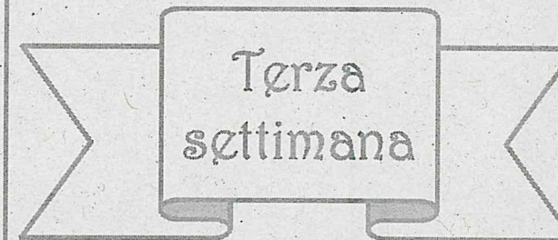
TABELLA DIETETICA PRIMAVERA-ESTATE Scuola dell'INFANZIA e PRIMARIA Comune di ORIA (BR)